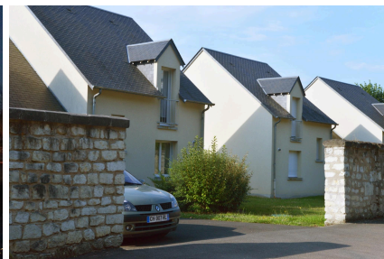
Lotissement intégré dans un clos de mur en tuf