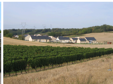
Lotissement intégré dans la pente

MOTS-CLÉS : urbanisme, zones pavillonnaires, planification, intégration territoriale et paysagère